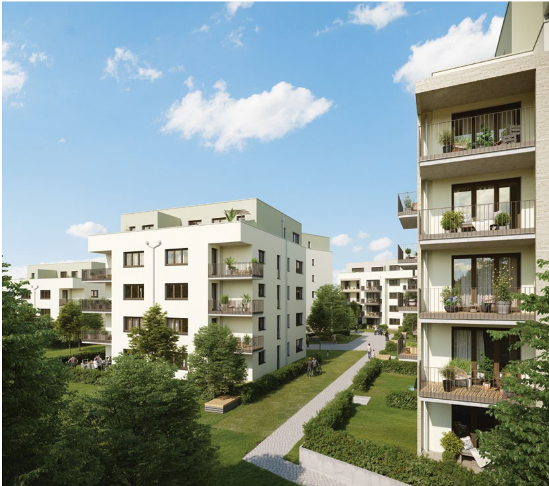
Heute gebaut, an morgen gedacht: das Römerquartier.

Ein Quartier, das überzeugt. Grün und mit viel Platz. Gut beleuchtet für ein sicheres Gefühl. Und zukunftsfähig in Sachen Energiestandards und E-Mobilität. Natürlich nicht zu vergessen die einladenden Wohnungen und Häuser.